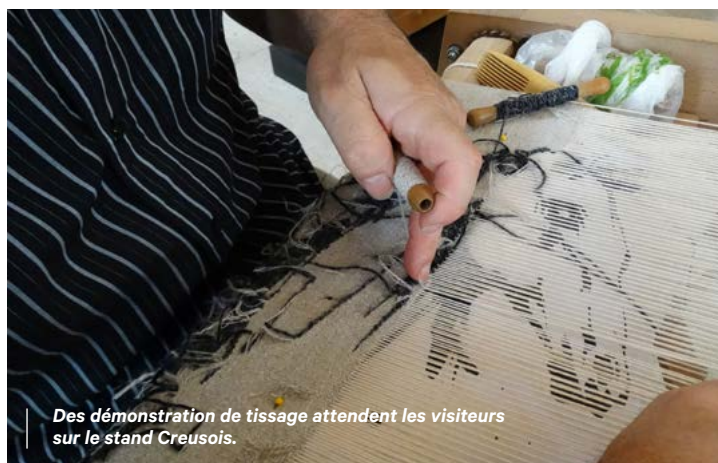
Des démonstration de tissage attendent les visiteurs sur le stand Creusois.