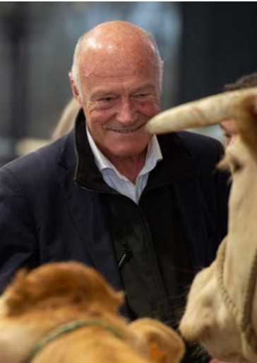
ALAIN ROUSSET PRÉSIDENT DU CONSEIL RÉGIONAL DE NOUVELLE-AQUITAINE