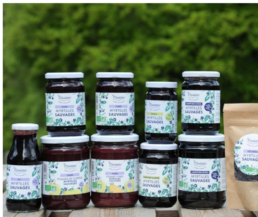
Les confitures à base de myrtilles sauvages à découvrir, parmi plein de nouveaux produits sur l'espace Nouvelle-Aquitaine du Hall 3