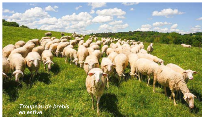
Troupeau de brebis en estive