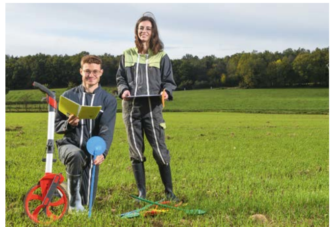
Basée à Vilhonneur en Charente, l'entreprise agritech Elicit Plant a trouvé une réponse aux changements climatiques et à l'appauvrissement de nos ressources en eau.