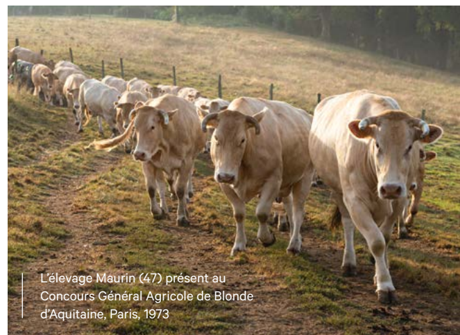
L'élevage Maurin (47) présent au Concours Général Agricole de Blonde d'Aquitaine, Paris, 1973

FLASHEZ Pour retrouver tous les détails sur les élevages