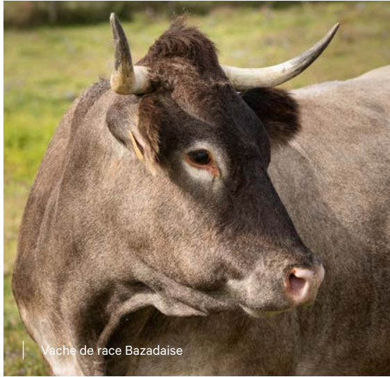
Vache de race Bazadaise

d'elle une race facile à élever, avec surtout de grandes facilités de vêlages et un caractère maternel prononcé. La Bazadaise s'illustre avant tout par ses qualités bouchères.