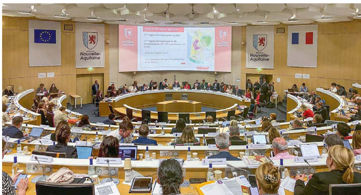
Plénière exceptionnelle consacrée à la MIE de la politique agricole et alimentaire régionale le 23 septembre 2024.

En effet, pour donner suite à la MIE, le montant de cette DNJA a été revalorisé pour tous et avec un effort particulier pour l'élevage (herbivores et granivores). Le montant maximum a été porté à 61 000 euros (contre 54 500 euros avant la MIE), ce qui porte la DNJA néo-aquitaine au-dessus de ce qui est proposé en Auvergne Rhône-Alpes (56 000 euros maximum) et en Occitanie (38 600 euros maximum). C'est un budget annuel réévalué de 13% en Nouvelle-Aquitaine, soit une augmentation de 3,5 millions d'euros par an jusqu'à la fin de la programmation, passant ainsi de 27,3 M€ à 30,8 M€/an, co-financé par l'Union européenne (FEADER).